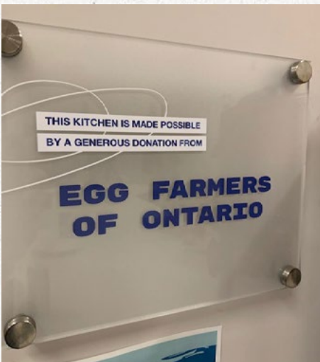
Plaque dans la cuisine du centre de Fergus.

DIRECTEUR EXÉCUTIF, THE GROVE YOUTH WELLNESS HUBS ONTARIO